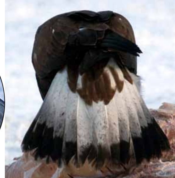
22 december 2007.