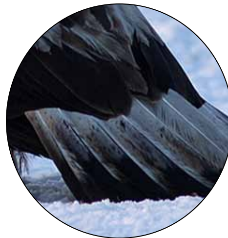
Ovan och nedan: Delförstoringar av bilden på motstående sida.