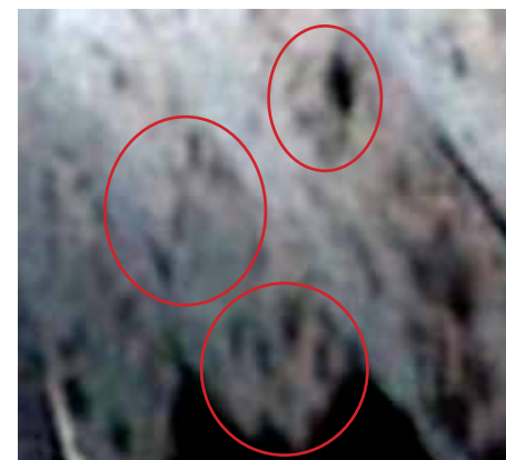
Fläckarna är klart tydligare hos Dirty under den andra vintern (foto t.v.)än vad de var under första vintern (th), men de stämmer mycket bra överens. Delförstoringar av bilderna på sida 3