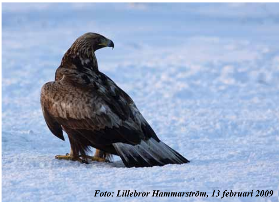
13 februari 2009